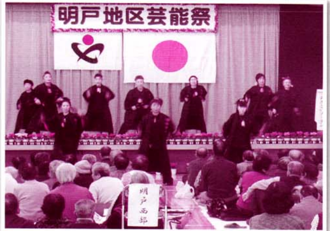
よさこいソーラン