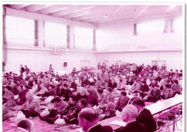
大勢の皆さんが楽しみました