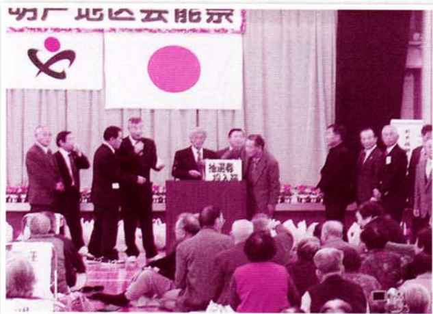
おたのしみ抽選会(好評でした)