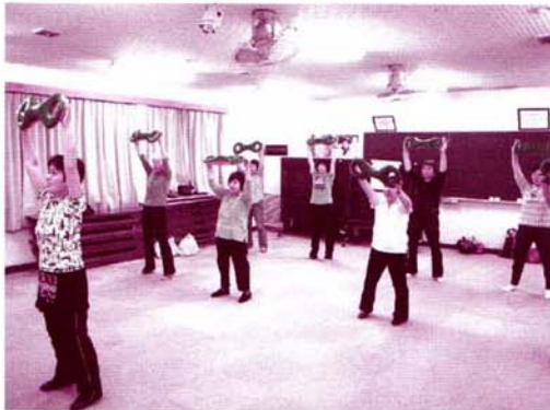
藤沢地区：大谷第一・第二サロン 3B体操で元気はつらつ!