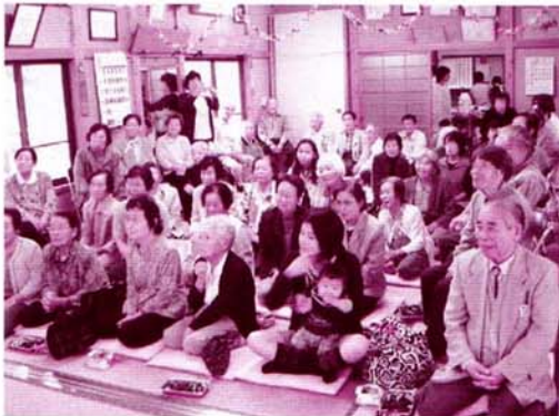
花園地区：ふれあいサロン・あらかわ 高齢者、子育て中のお母さんも参加しています。