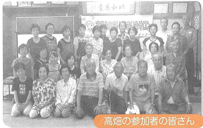
高畑の参加者の皆さん