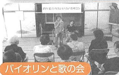
バイオリンと歌の会

今後も、肩のこらない楽しいサロンを作り、地域の絆を深める場となれるよう続けていきたいと思っています。