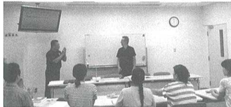
手話通訳者養成講座は現在開講中

社協事務所内にある専任手話通訳者は、通訳の依頼を受けたり聞こえない方の相談や、電話をかけるお手伝いをしています。