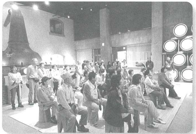
天然水の製造工程について学んできました。20年以上かけておいしい天然水となることに驚きました。