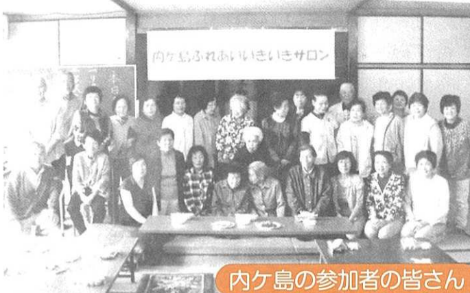
内ヶ島の参加者の皆さん

平成28年の5月に立ち上げてすでに12回開催しています。開催場所は内ヶ島の自治会館で年間5回のペースで行われています。今回は7月に開催した時の内容を紹介します。まず、地元の駐在官による特殊詐欺の被害防止など防犯の講話をしていただいた後、サロン応援隊から「バイオリンと歌の会」のお二人を招いて、演奏に合わせながら大きな声で懐かしい童謡や歌謡曲を歌いました。演奏終了後は皆さんでお茶の時間となりました。お茶を飲みながらおしゃべりを楽しみました。