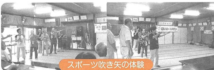
スポーツ吹き矢の体験