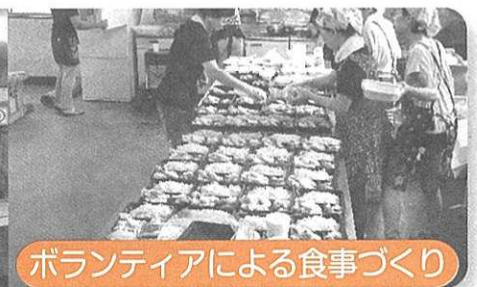
ボランティアによる食事づくり