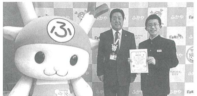
▲岡部中学校に感謝状贈呈