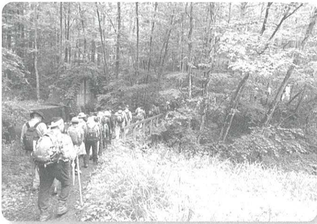
武田信玄が信濃侵攻に使用した軍用道路で川中島の戦いでもこの道を使ったそうです。