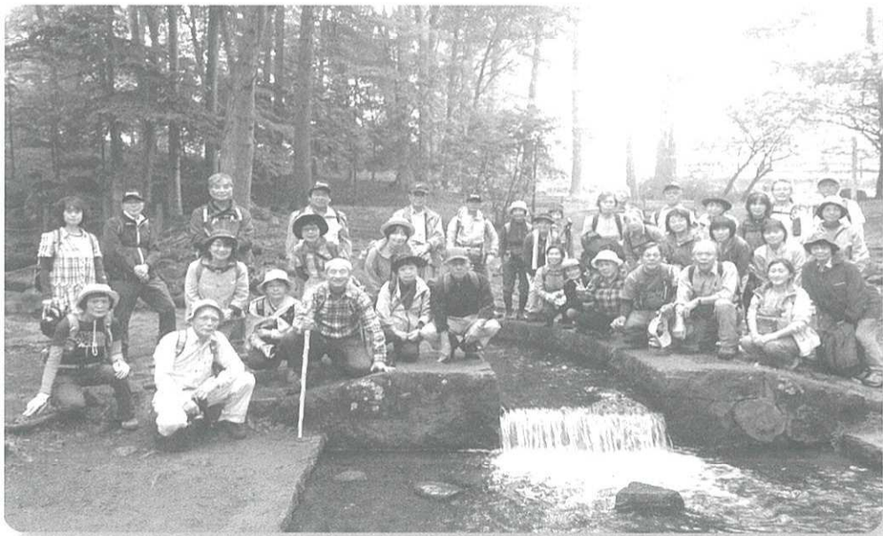
三分一湧水で記念写真。武田信玄が戦国時代に水争いをしていた3つの村に平等に水を分配するために築いたという三分一湧水は八ヶ岳の伏流水で日本名水百選に選定されています。