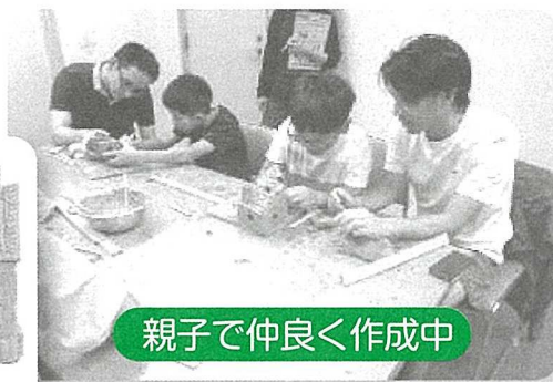
親子で仲良く作成中