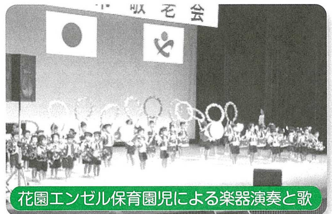
花園エンゼル保育園児による楽器演奏と歌