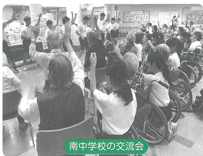
南中学校の交流会