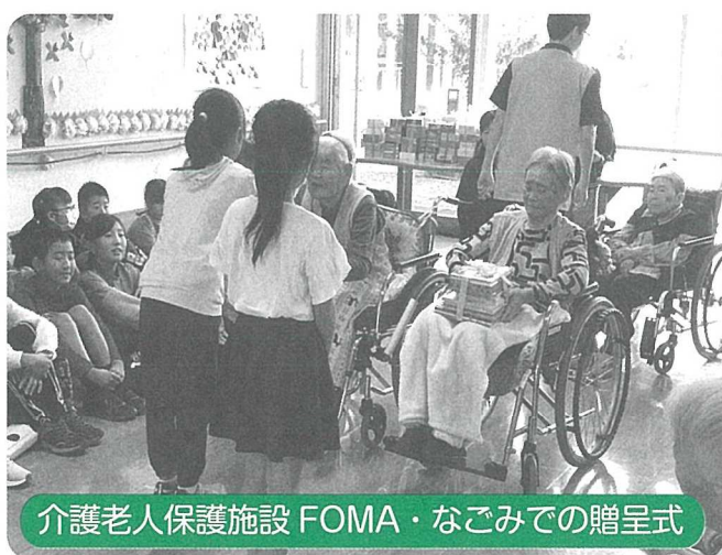
介護老人保護施設 FOMA・なごみでの贈呈式