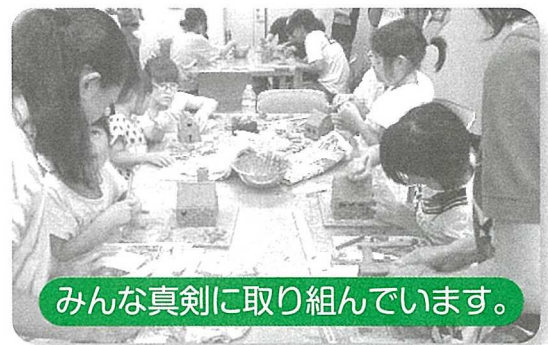
みんな真剣に取り組んでいます。