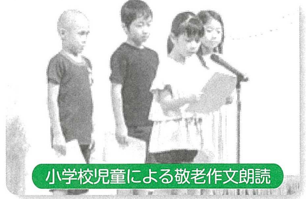
小学校児童による敬老作文朗読

続いて花園幼稚園児による歌と踊り、花園エンゼル保育園児による楽器演奏と歌を披露していただきました。大きな口を開けて一生懸命取り組む姿に心を打たれたくさんのパワーをもらいました。