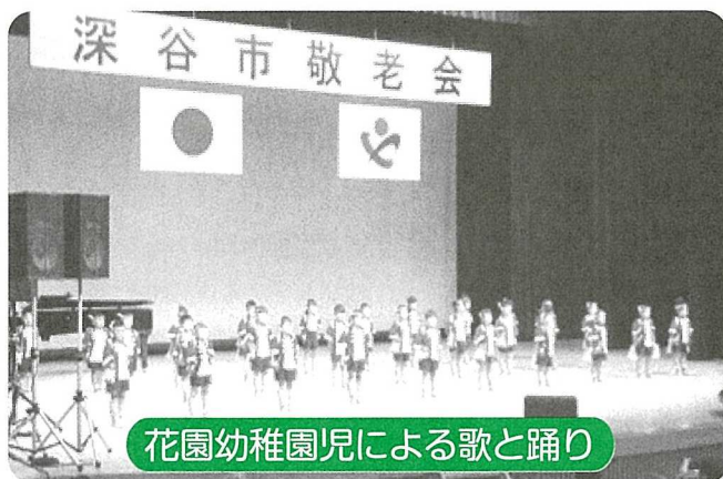
花園幼稚園児による歌と踊り