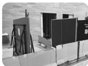
●プライバシーを守ります。