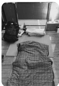
●1.8m×1.8mのスペースに2人は狭い。