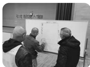
●話し合って、振り分けます。

また、深谷市社会福祉協議会では、災害ボランティアを募集しています。ぜひ、皆様のお力をお貸しいただければと思います。