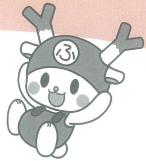
深谷市イメージキャラクター ふっかちゃん

新型コロナウイルス感染拡大の影響で、「手話奉仕員養成講座 入門」と「手話通訳養成講座」の開講を見合わせておりましたが、感染拡大の状況をみながら慎重に協議をした結果、受講される皆様と講師の安全を考え、今年度の講座はすべて中止とさせていただきます。来年4月には、講座が開講できること願うばかりです。楽しみにして下さっていた皆様、講座でお会いできることを楽しみにしています。