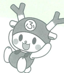
深谷市 イメージキャラクター ふっかちゃん

渋沢栄一は深谷市血洗島の農家に生まれました。ヨーロッパの進んだ思想・文化・社会などに大きな影響を受けながら、「論語」の精神を大切に、いろいろな産業の育成と確立に努め500以上の企業創立に関わりました。また、身寄りのない子どもや老人のために「養育院」を設立するなど、600を超える社会福祉事業に関わりました。深谷市社会福祉協議会の上部組織、全国社会福祉協議会の前身である「中央慈善協会」の初代会長は渋沢栄一だったのはご存知ですか？